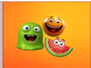
Figura 1. Patrón pedagógico de la estrategia.