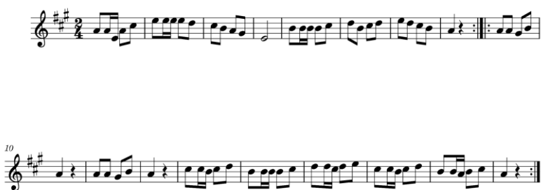
Figura 5: Línea melódica del bandio en variante de “la marcha”. Transcripción de Cristian Yáñez Aguilar.

Interpretación: Ponciano Rumián Lemuy. Transcripción: Cristian Yáñez Aguilar