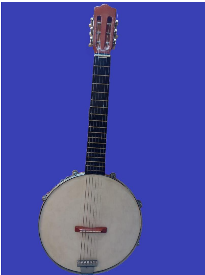
Figura 2: Bandio construido en el territorio de San Juan de la Costa. Actualmente es ejecutado en performances músico-dancísticas de la Agrupación Miancapué de Chiloé.

y parte de su configuración es realizada por el bandio, mientras que la propia ejecución, tanto ritual como en cualquier instancia donde es tocada por las bandas de rogativa, simboliza la cosmovisión actualizada en la comunicación ritual (Moulian 2012) (ver Figura 3).