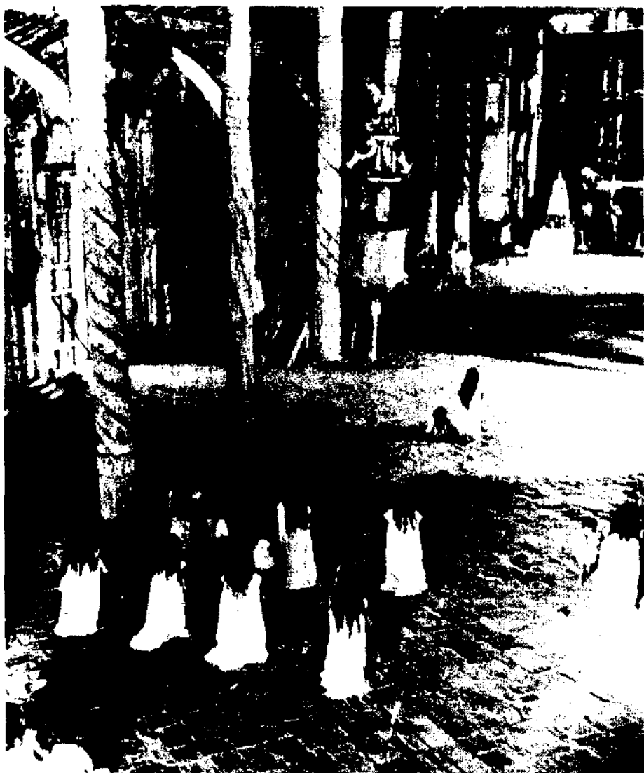
Fotografía tomada en 1936 en una de las Iglesias del complejo jesuítico de los indios Chiquitos. Obsérvese que la tradición aún viva del período colonial de rezar mujeres y niños ante la Virgen con su cabello suelto y vestimenta blanca.