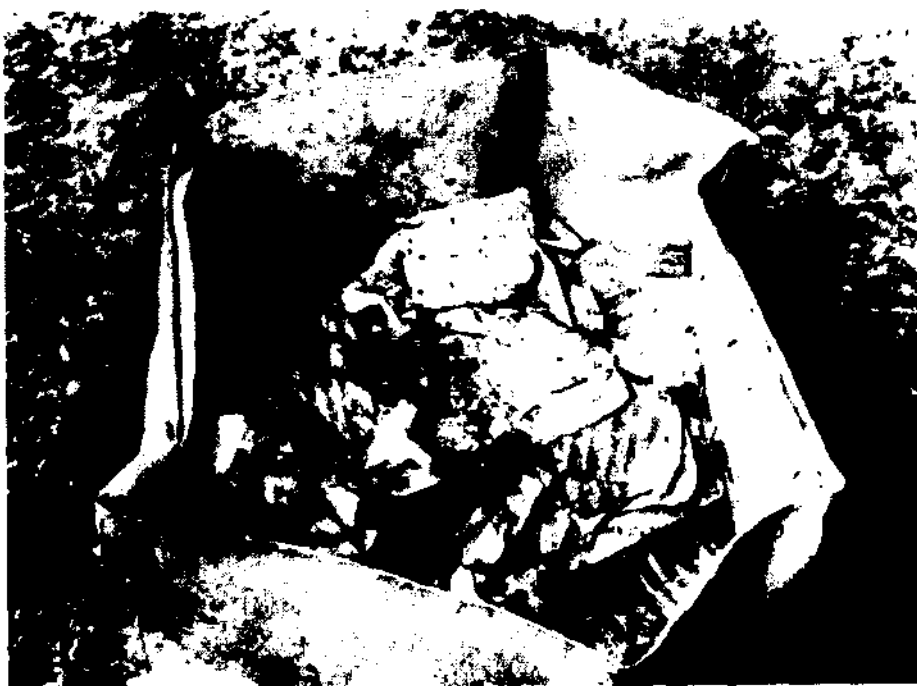
Estado de conservación de música detectada en la región de Chiquitos.

cuerpo social. Otros hablaban de enormes tesoros escondidos bajo tierra. No obstante, la Compañía de Jesús basaba su poder económico en la venta de numerosos productos y en trueques, a fin de abastecer de productos necesarios a las poblaciones a su cargo y para la adquisición de imágenes y otros objetos para el culto. No desdeñaron vender el excedente de esclavos negros, principalmente al Altiplano, un contrasentido con respecto a la auténtica doctrina cristiana, porque consideraron al indio como gentil y al hombre de color como un salvaje. (De este criterio participó también Fray Bartolomé de las Casas quien buscó por medio de sus alegatos exclusivamente la liberación del indígena). Pero en las inmensidades de la América hispana el brazo de la justicia real era inoperante.