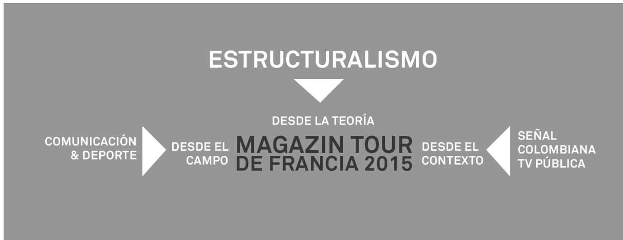
Gráfico 1. Estructura del marco teórico