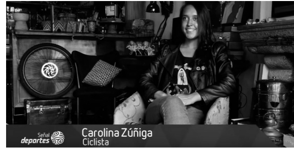
Imagen 4. Una joven ciclista enseña cómo viajar por Colombia en bicicleta.